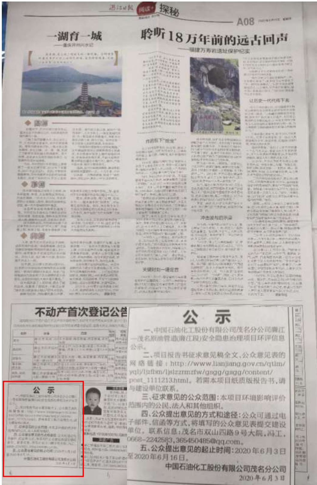
图 3-3 征求意见稿报纸公示截图（第二次登报）