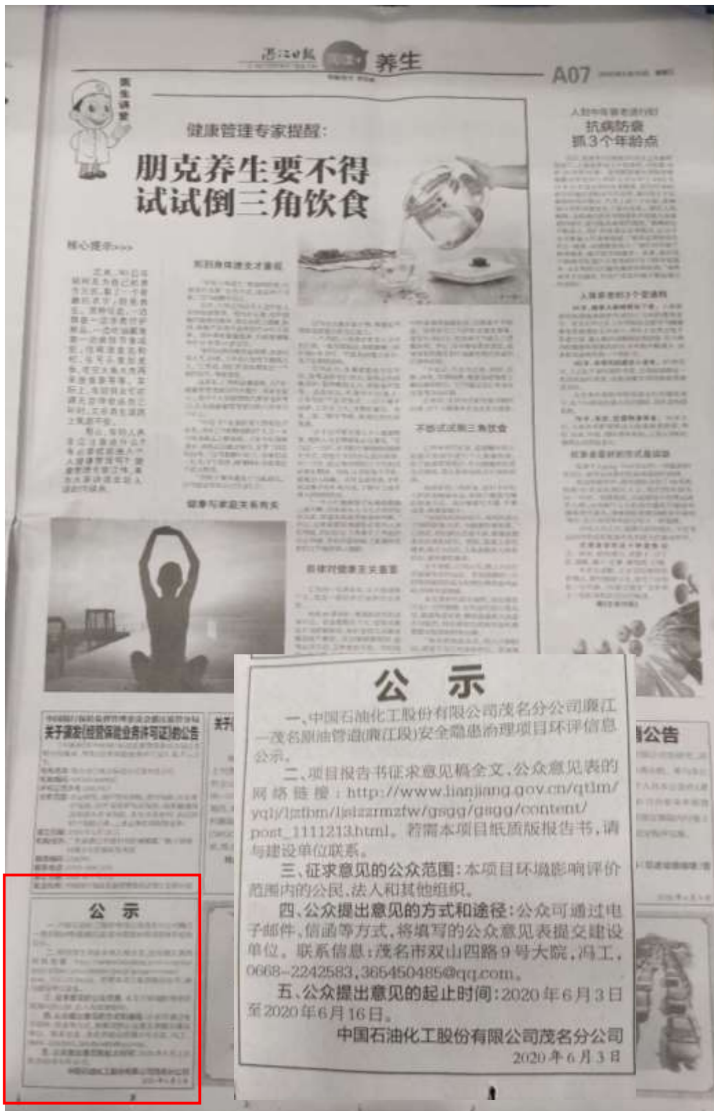
图 3-2 征求意见稿报纸公示截图（第一次登报）