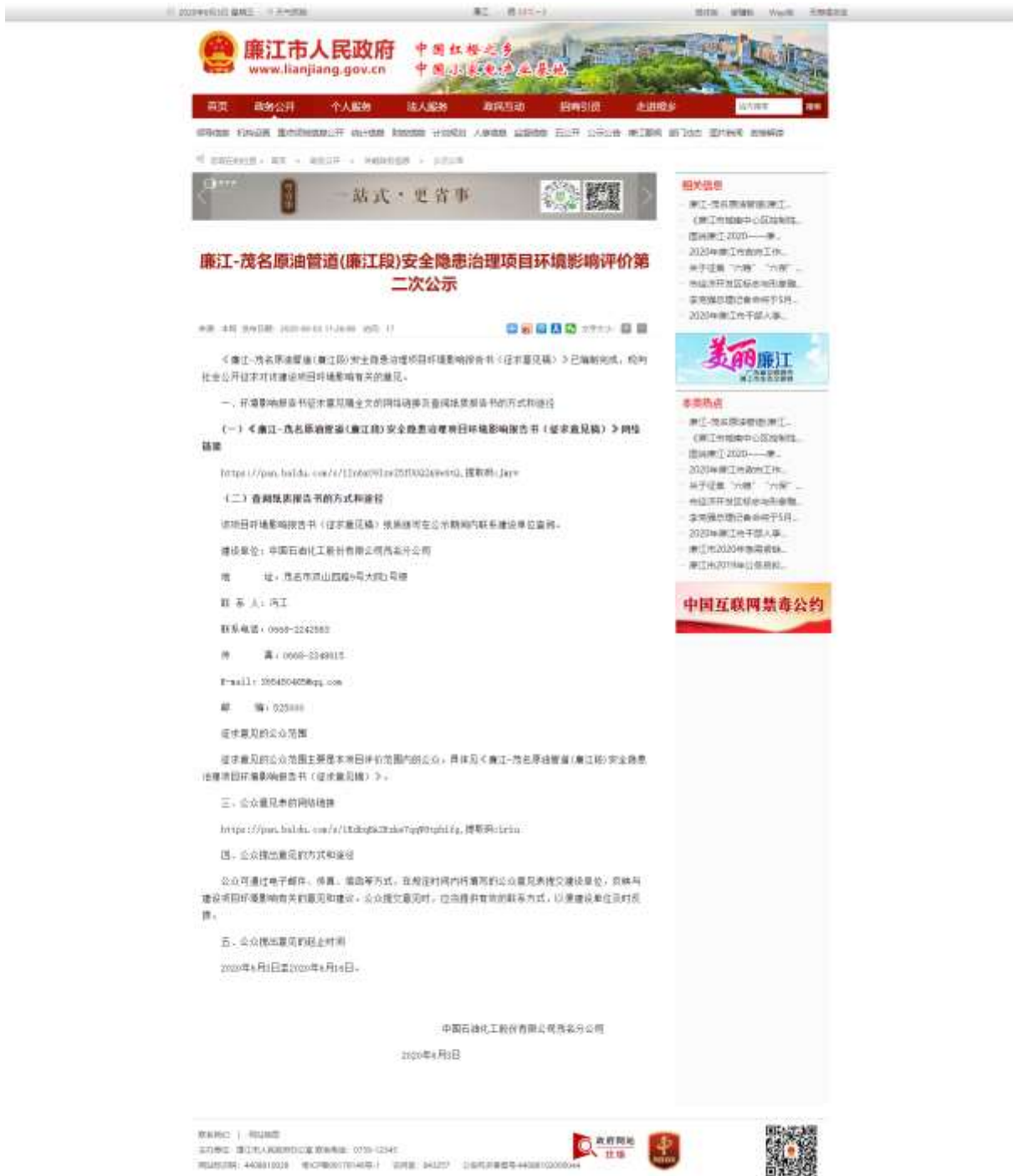
图 3-1 (2) 征求意见稿网络平台公示截图