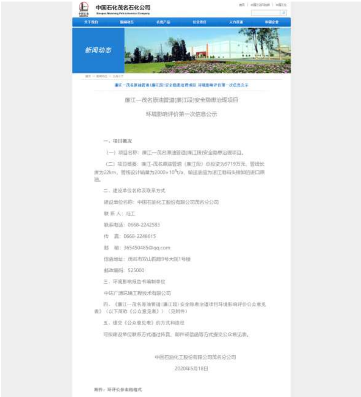
图 2-1 首次环境影响评价信息网络平台公示截图