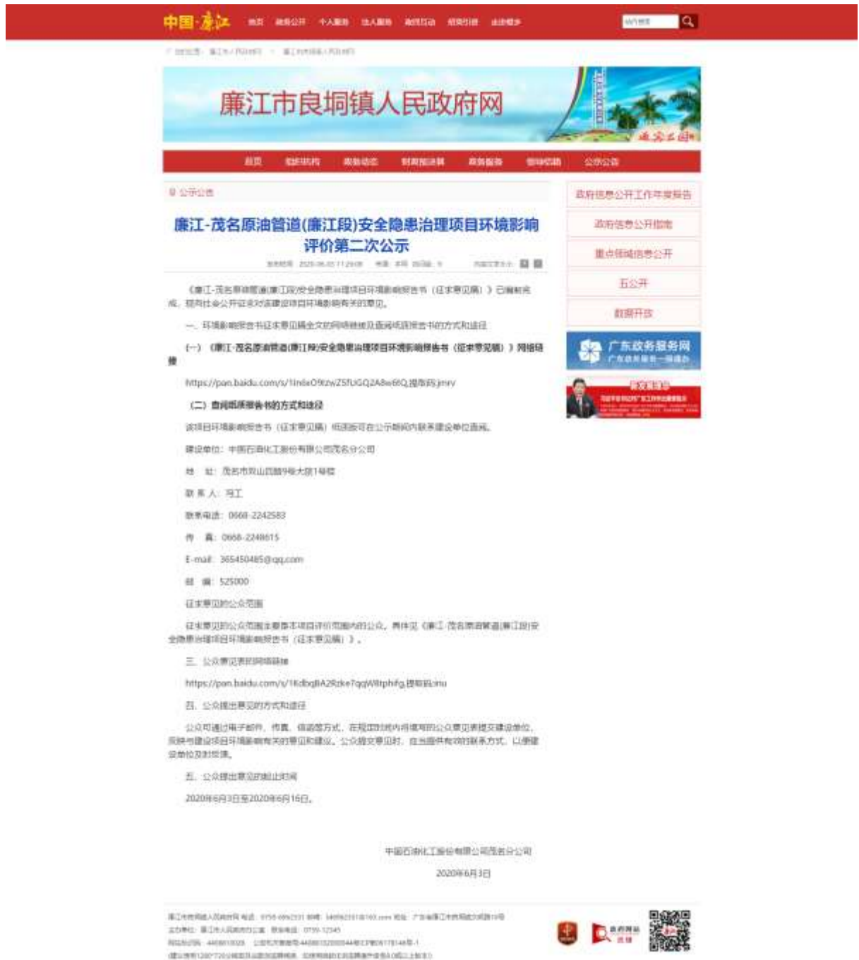
图 3-1 (1) 征求意见稿网络平台公示截图

载体选取符合性分析： 本项目征求意见稿公示方式采用廉江市良垌镇人民政府网、廉江市人民政府网，在建设项目环境影响报告书征求意见稿形成后，且征求公众意见的期限不少于10个工作日（公示日期：2020年6月3日至2020年6月16日）。因此本项目征求意见稿公示的载体选取符合《公众参与办法》要求。